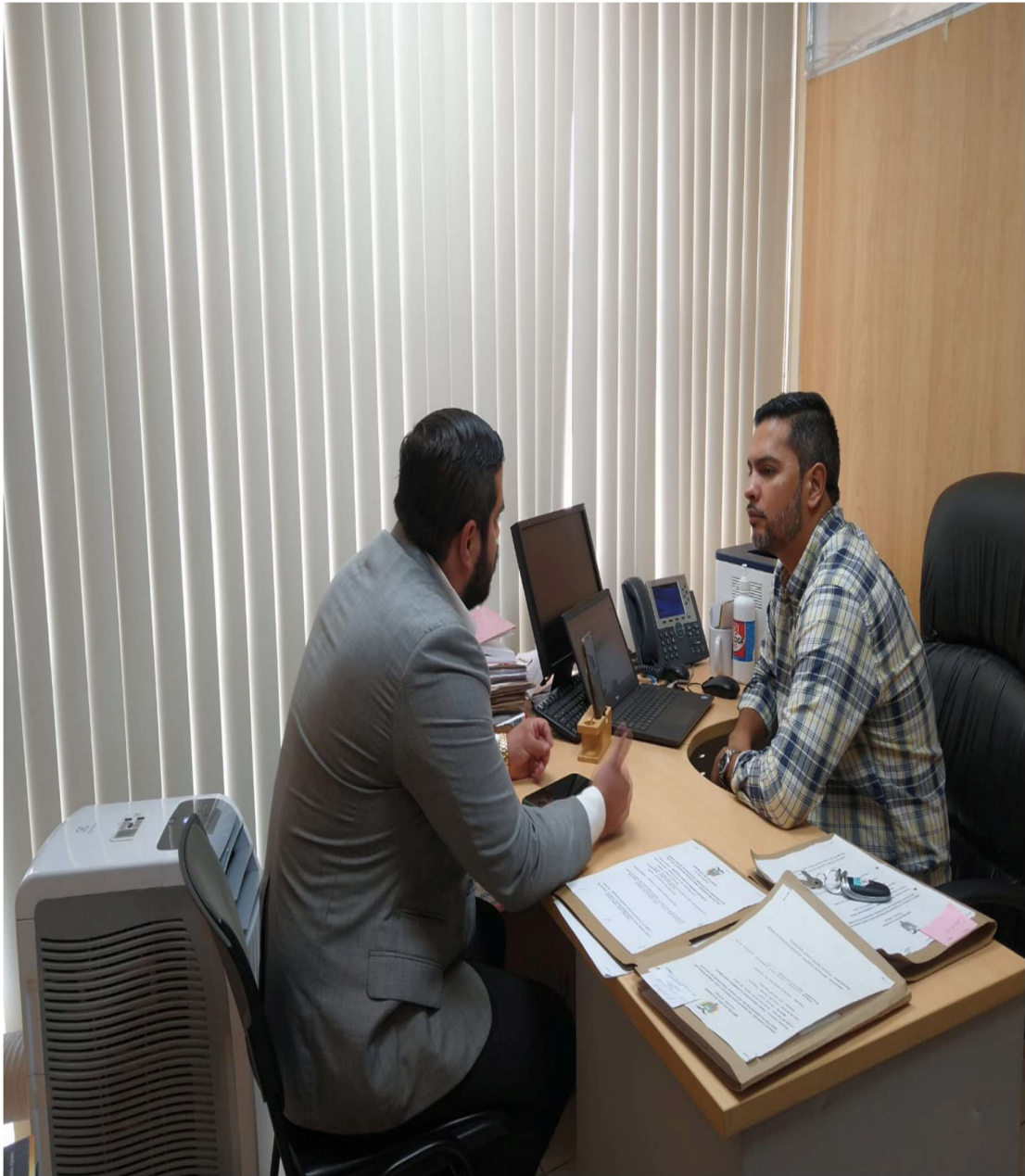
Figura 2. Entrevista realizada al Juez gustavo Guerra