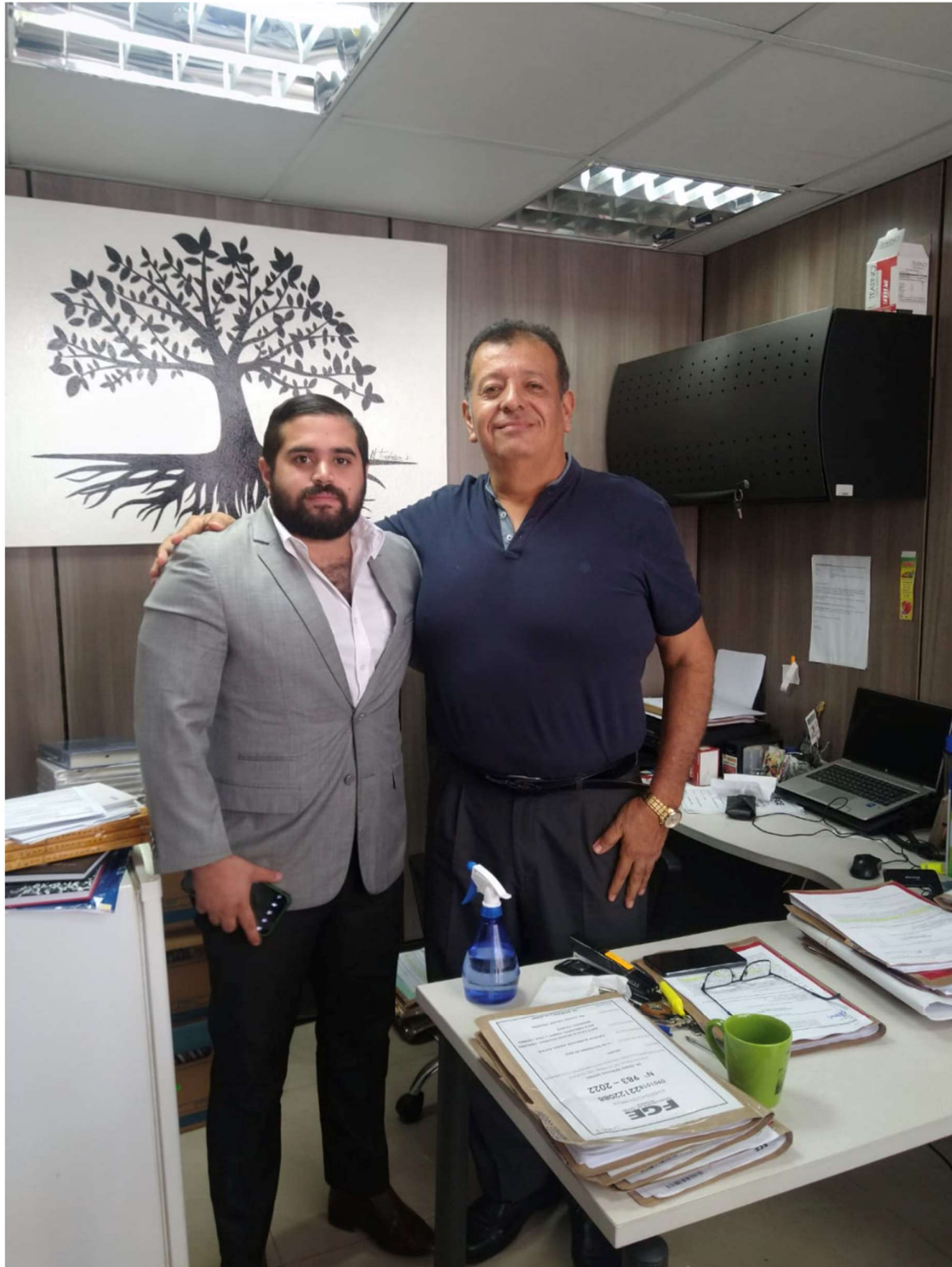
Figura 3. Entrevista realizada al Fiscal Geovanny Intriago