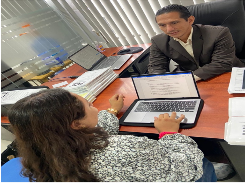
Figure 5:Entrevista con el fiscal Hugo Bararata Miele