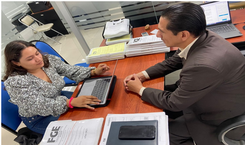
Figure 6: Entrevista con el fiscal Hugo Bararata Miele