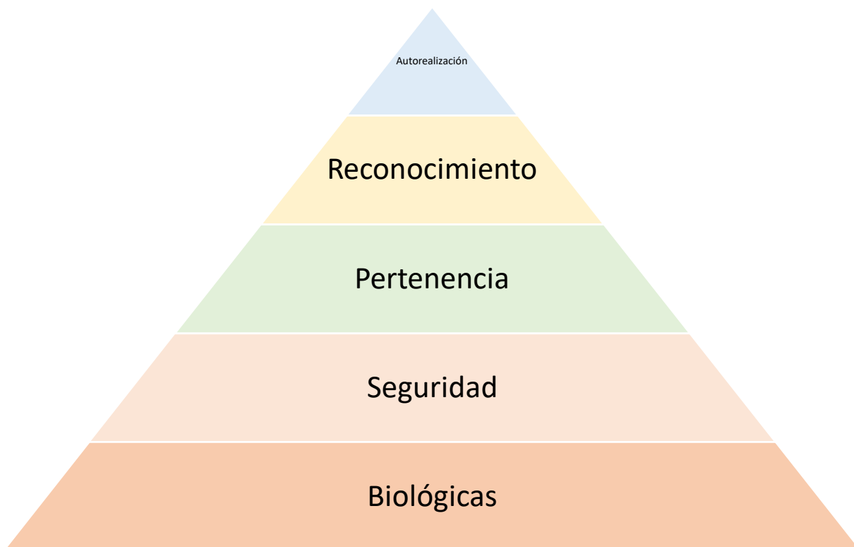
Figura 1 Pirámide de Maslow

Nota: Esta figura hace referencia a la pirámide de Abraham Maslow Tomado de: (Maslow, 1991)