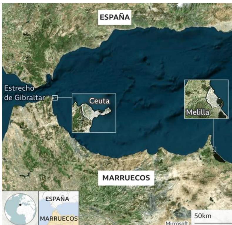
Figura 2 Ubicación geográfica de los enclaves de Ceuta y Melilla.